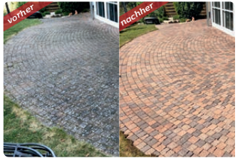
Terrassen & Höfe