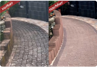
Eingänge & Wege